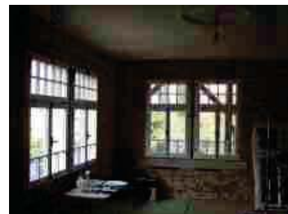
Dieses Objekt wurde als Wohnhaus auf den neuesten Stand gebracht.